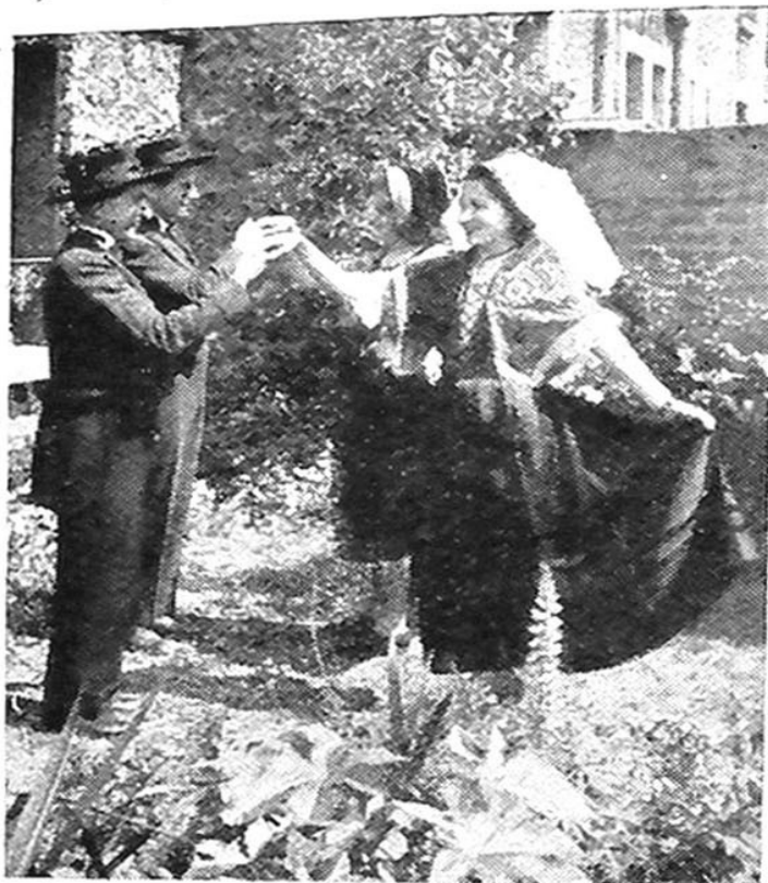
N° 8 |